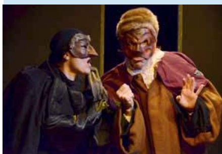
Mise en scène : Benjamin Ziziemsky

Nous avons l'intention de vous conter cinq renarderries qui vous fassent rire !