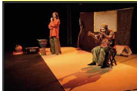
Mise en scène : Maryline Andia Destor

« Embrasse trois fois la lune et le conte t'emmènera... »