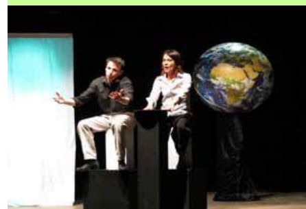
Auteur : Christophe Moyer Mise en scène : Benjamin Ziziemsky

Il existe mille façons d'agir, et une seule de ne rien faire !