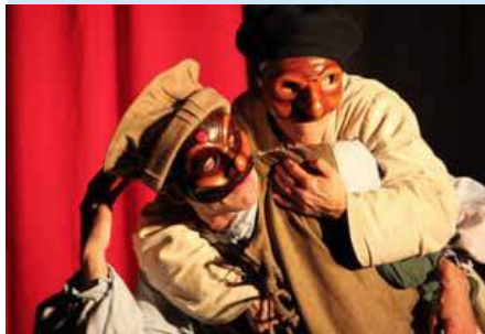
Mise en scène : Benjamin Ziziemsky

Les temps sont durs pour Maître Pathelin, avocat sans procès à plaider.